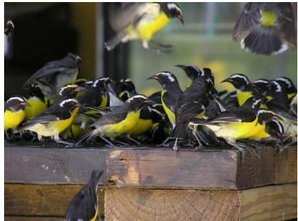
Suikerdiefjes op de voertafel (met suiker)