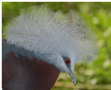
Roodborst kroonduif (Walsrode)