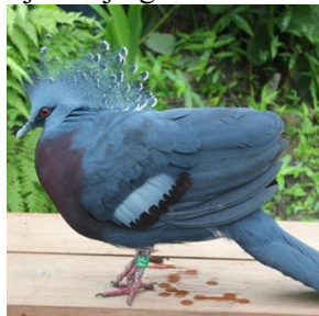
Victoria kroonduif (Wildlands Emmen)