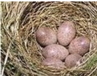
Legsel van sprinkhaanzanger.